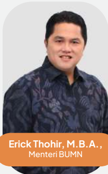
Erick Thohir, M.B.A., Menteri BUMN