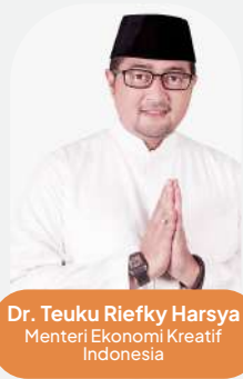
Dr. Teuku Riefky Harsya Menteri Ekonomi Kreatif Indonesia