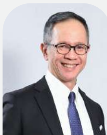
Dr. Mahendra Siregar, M.Ec., Ketua Dewan Komisiner Otoritas Jasa Keuangan