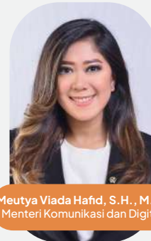
Meutya Viada Hafid, S.H., M.H., Menteri Komunikasi dan Digital