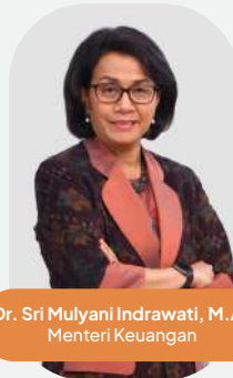
Dr. Sri Mulyani Indrawati, M.A., Menteri Keuangan